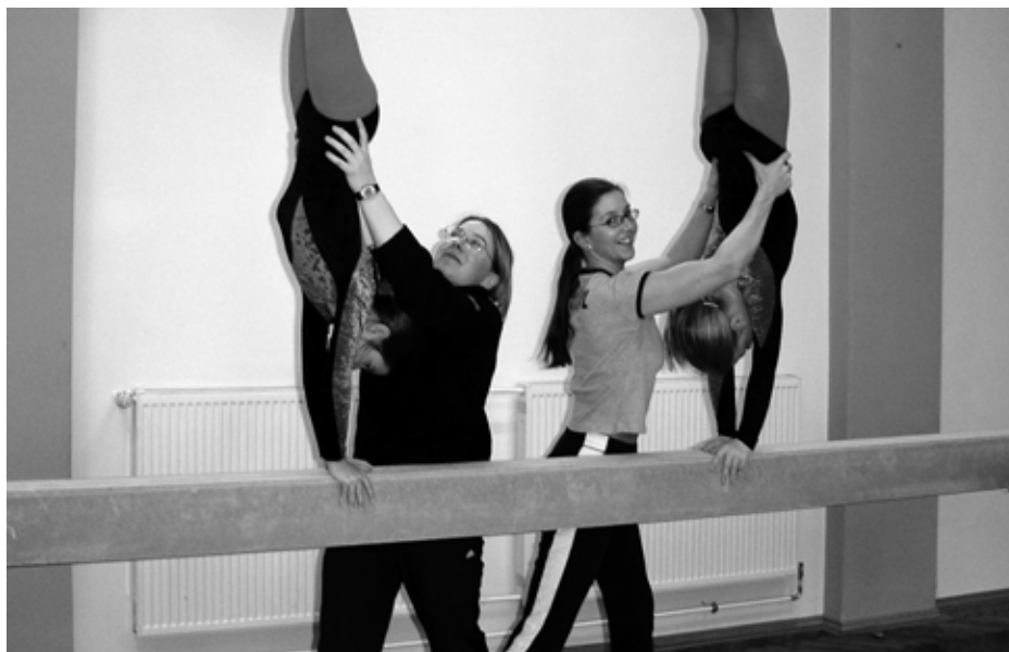
Für unsere engagierten Übungsleiter soll der staatliche Zuschuss zukünftig deutlich gekürzt werden.