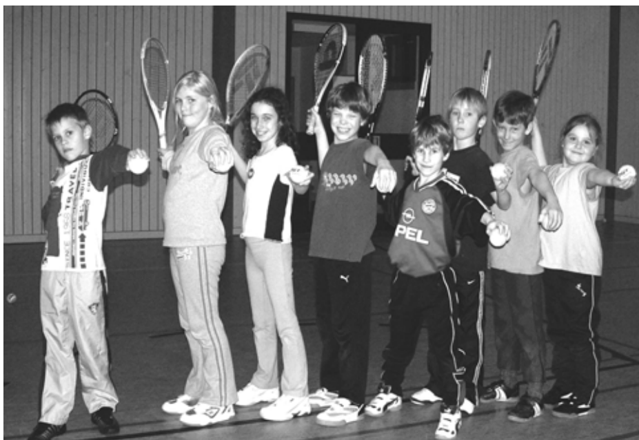
Spaß von Anfang an